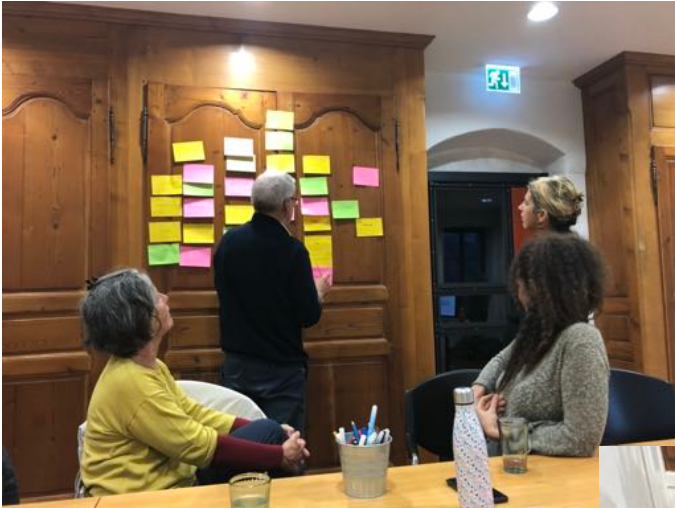
Séance de travail du comité et des élu-es le 18.10.22